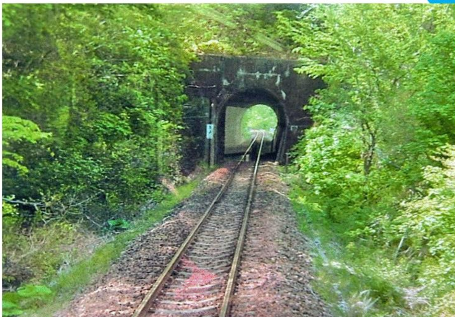
「新緑の三陸鉄道」 (岩手県) 日高 勝之

三陸は美しい海岸と地形が織りなす絶景の地です。タイミング良く新緑の中トンネルに入りトンネルを出たところで美しい海岸に又魅了されました。