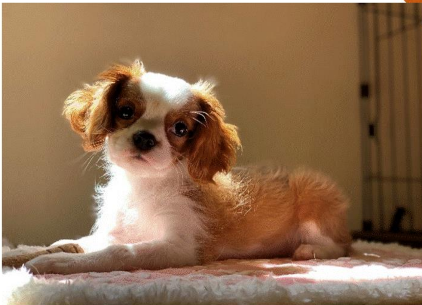
「私の愛犬」 (鹿児島市) 岩田 剛明