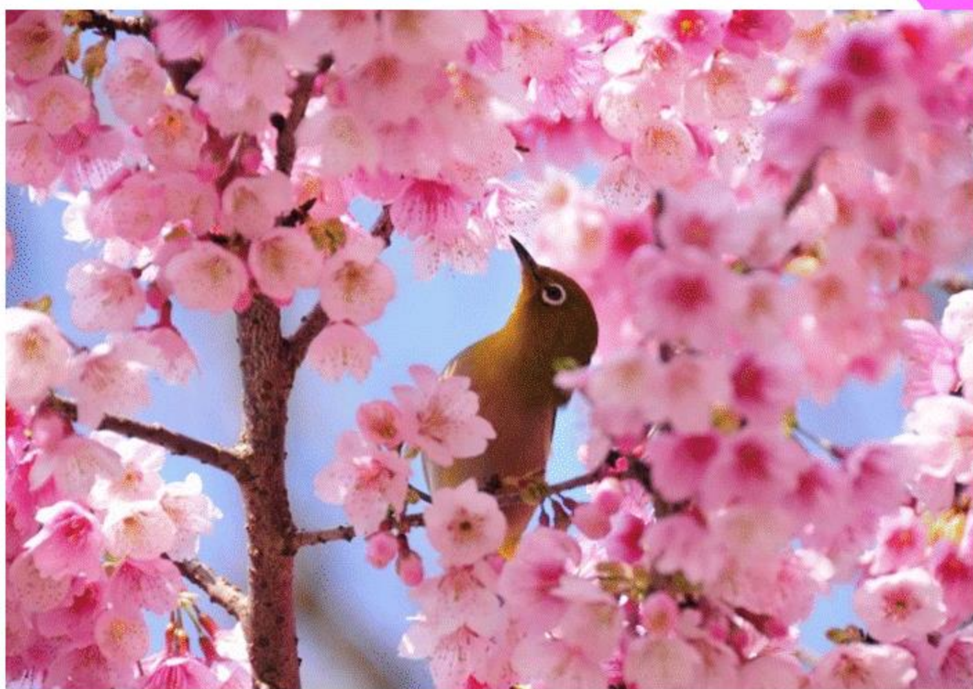
「春のほほえみ」 (薩摩川内市 藤川天神)