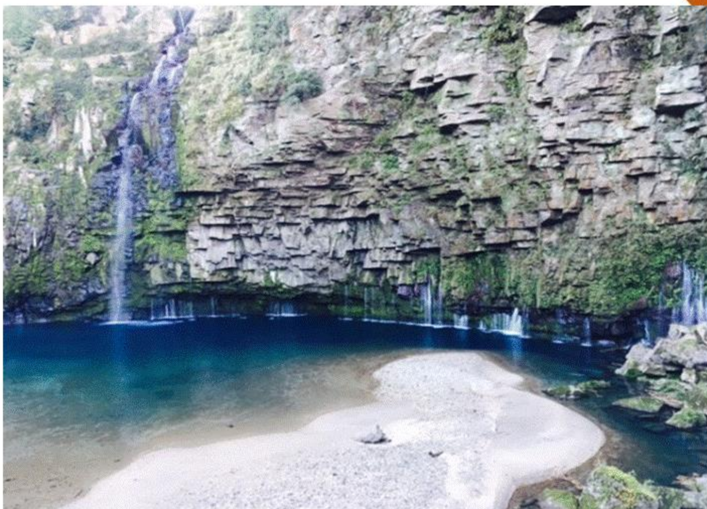
「雄川の滝」 (南大隅町 根占) 下村 未来