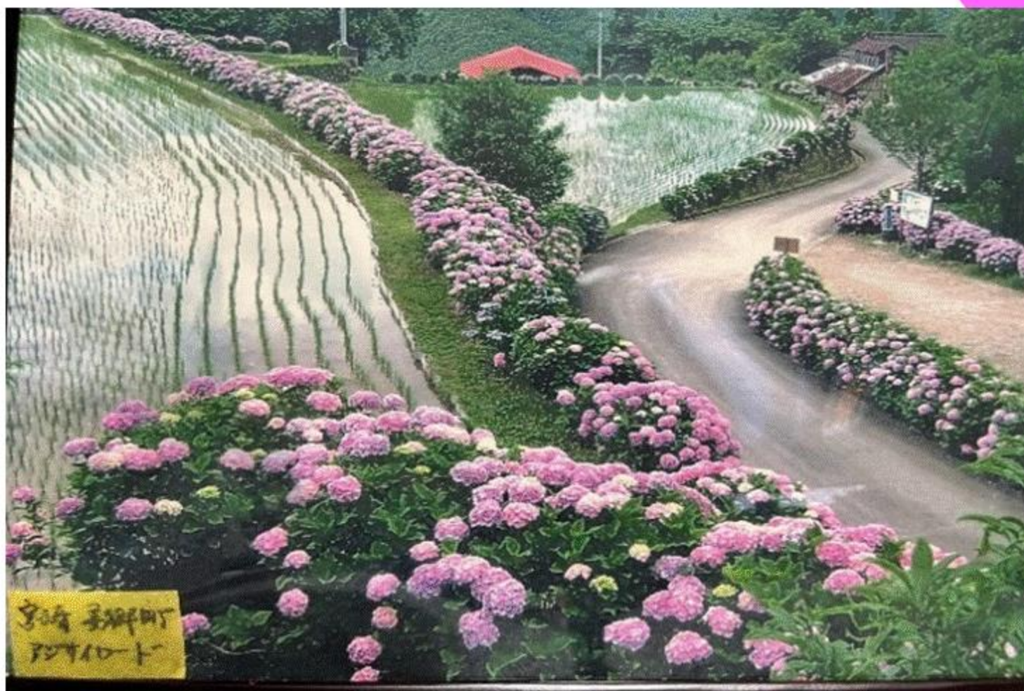
「アジサイロード」 (宮崎県 美郷町)

2月中旬藤川天神は合格を祈願する受験生や家族などで賑わいます。社殿の前には、寒緋桜が淡いピンク色の花を咲かせ、メジロが蜜をついばみ甘い香りが観梅客の心を和ませています。