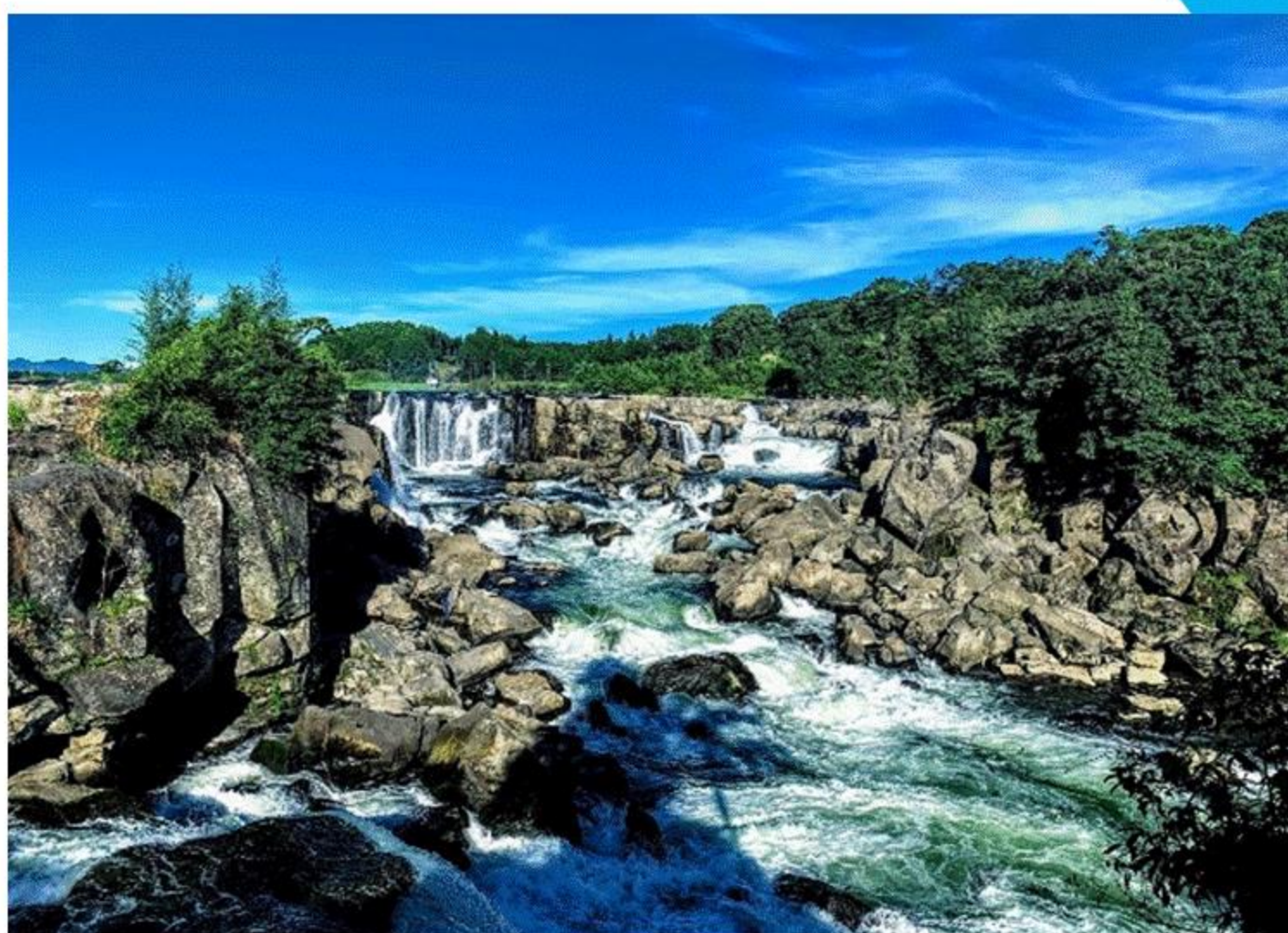
「曾木の滝」 （伊佐市） 岐部 哲也